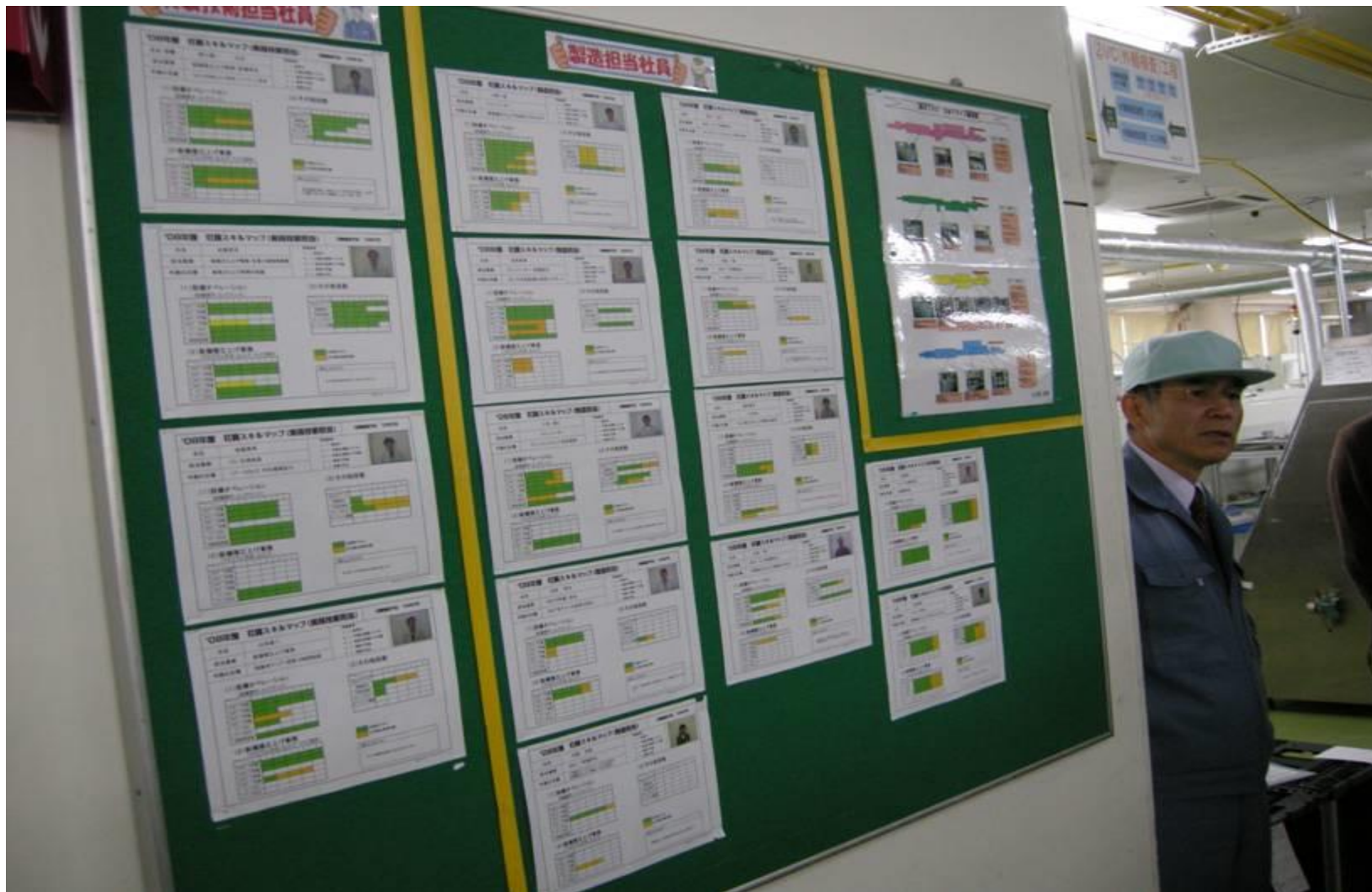
ماتریس مهارت های کاری