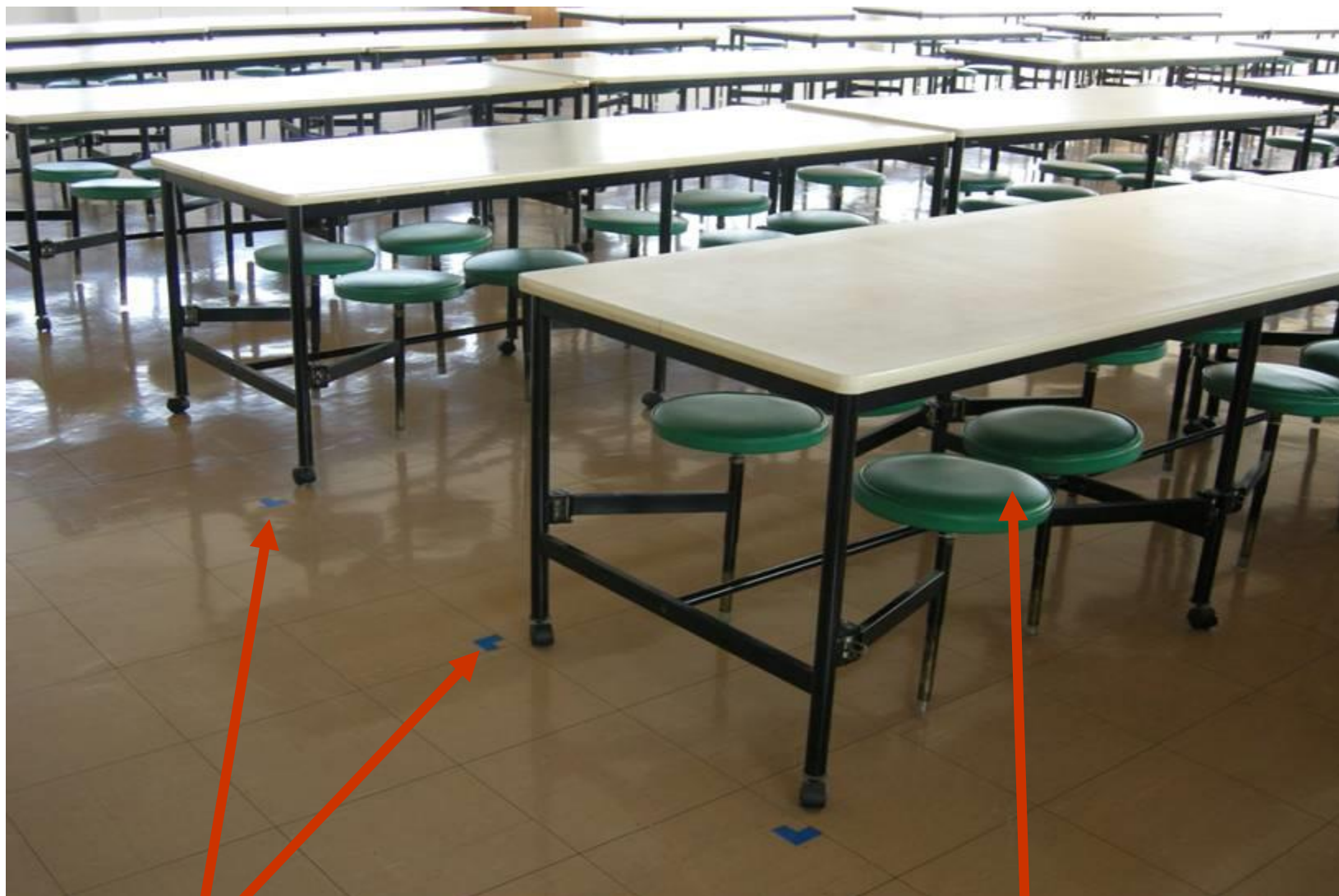
نشانه گذاری محل قرارگیری میزها