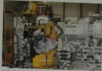
ダイキャストマシン