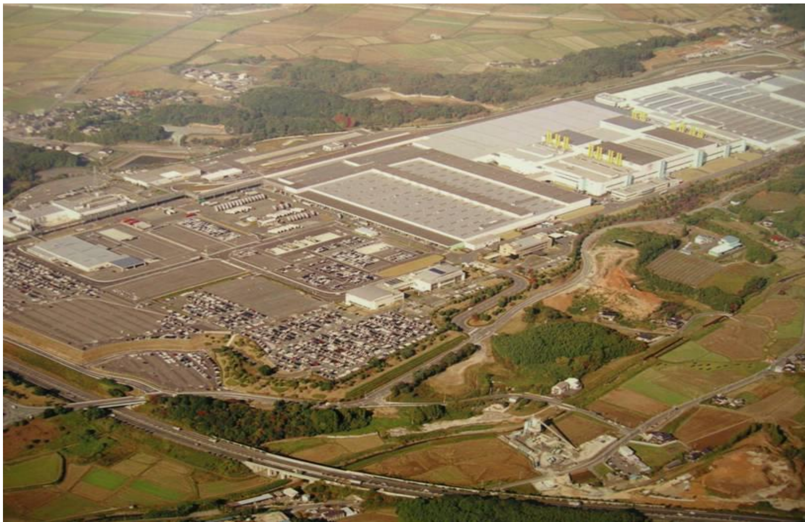
کارخانه تویوتا در ژاپن